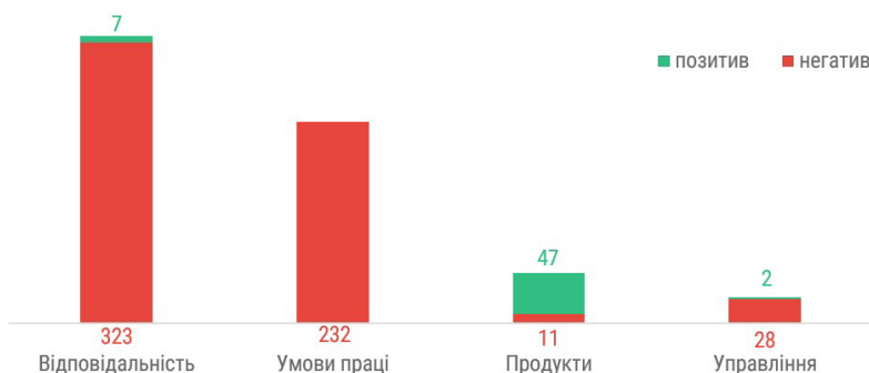
Рисунок 2. Репутаційні фактори, зачеплені інформаційною кризою видавництва «Наш формат», кількість дописів.

зокрема проросійських, до подій у цій сфері. В тому числі – і для російської пропаганди, як ми бачили у кейсах «Книголаву», «Фоліо» та «Нашого формату». Такі кейси стають найпомітнішими для широкої аудиторії. Це також є наслідком того, що книжкова індустрія дедалі частіше перетворюється на політичний фактор.