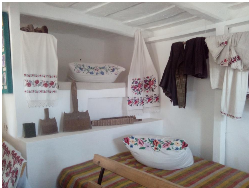
У хатині Василя Симоненка

Далі їдемо до школи, в якій поет навчався та до якої ходив цілих 9 кілометрів пішки, і це - в одну сторону. Тут ми відвідали музей Василя Симоненка. Із захопленням розглядаємо його світлини, впевнено стверджуємо, що на випускному фото зі своїх однокласників Василь Андрійович - найгарніший кавалер. У цьому музеї теж бачимо книжкову виставку Симоненкових творів, багато портретів поета, вималювані на стінах уривки віршів. Можна знайти тут й написану Симоненком заяву з проханням зарахувати його до 8 класу. Уважно вивчаю його почерк, ще такий дитячий, але такий охайний, і не вірю власним очам, що це писав сам поет і зараз я на це дивлюся!